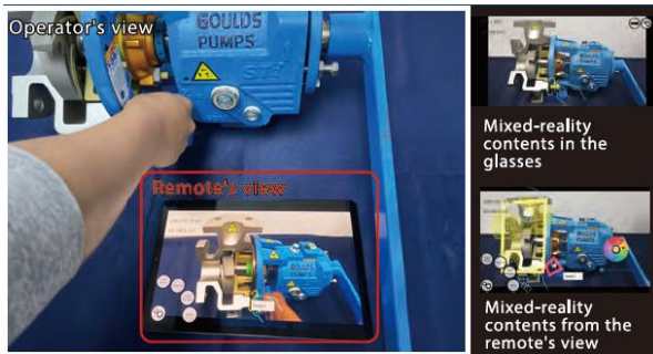
▲ 圖說：MR 互動引導